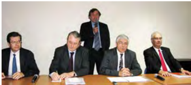
Les représentants d'ALPHA et de la CFE-CGC : « comment prévenir le stress professionnel... »