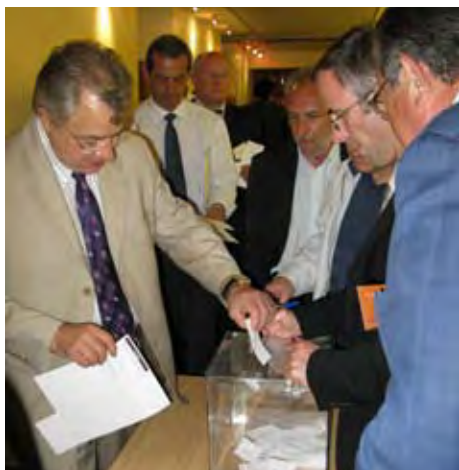
Le vote du comité confédéral